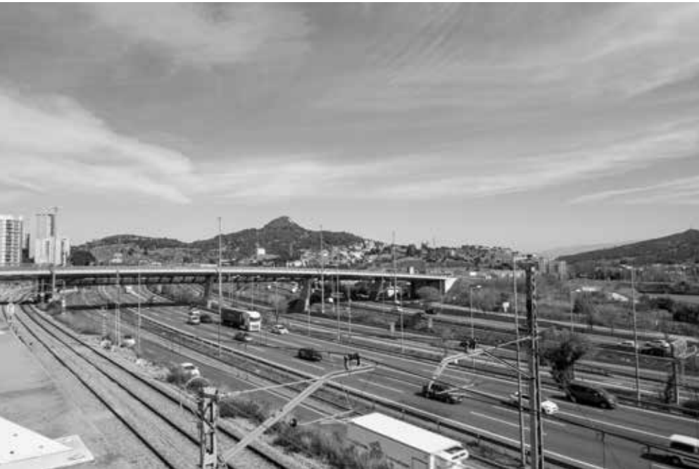
La Meridiana i les Rondes són ferides obertes entre els barris i focus de contaminació i soroll.

Coordinadora d'Associacions de Veïns i Entitats de Nou Barris