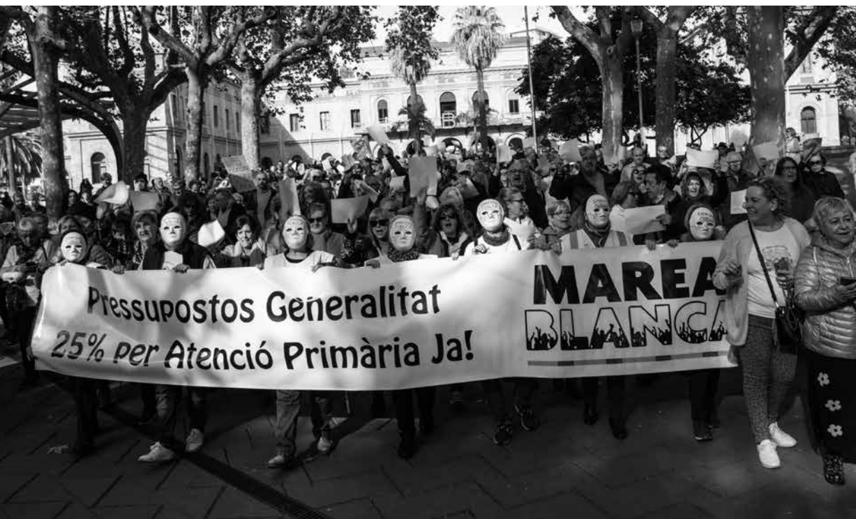
Concentració a Nou Barris per exigir més pressupost per a l'Atenció Primària en salut, el passat 27 de novembre de 2022.

Tot i que la Generalitat té major pes competencial en Sanitat, l'Ajuntament de Barcelona ha d'exercir pressió des del Consorci Sanitari de Barcelona perquè aquestes demandes siguin ateses. A més, ha d'assumir les seves responsabilitats envers els factors determinants de la salut, treballar per combatre les desigualtats, donar resposta a les necessitats dels equips sanitaris als barris i promoure consells de participació en els centres de salut.