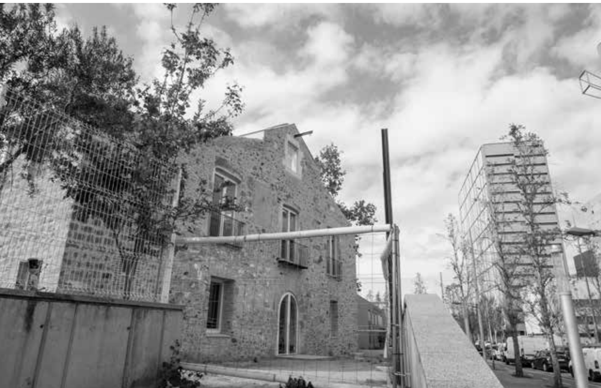
La masia de Can Valent ha d'esdevenir el centre neuràlgic de l'eix verd del barri. Joan Linux-9 Barris imatge