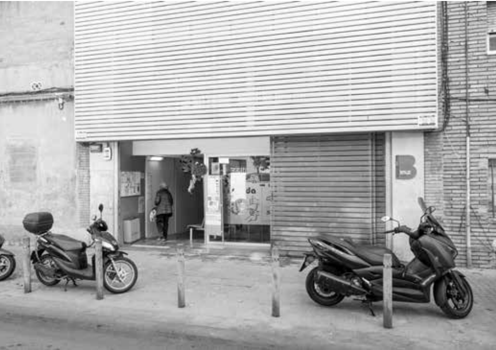
El Centre Ton i Guida, fundat l'any 1993, és un dels equipaments de gestió ciutadana del nostre Districte. Les entitats demanen la seva ampliació. Joan Linux-9 Barris imatge