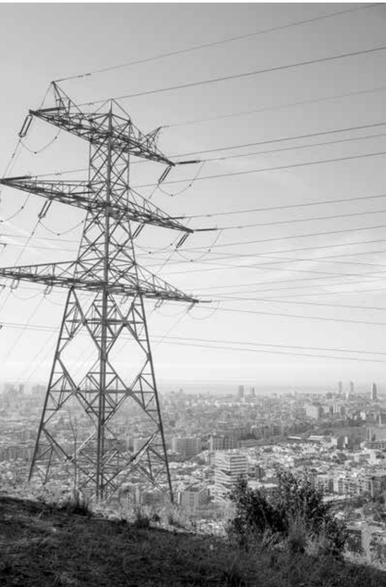
Les torres d'alta tensió travessen el parc natural de Collserola: la reivindicació històrica per al seu soterrament continua viva a Nou Barris. Joan Linux-9 Barris imatge

Des de la comunitat de Can Masdeu es demana a l'Ajuntament la inversió en aquest projecte, amb un cost de 200.000 euros, que podria abaratir-se si els usuaris de l'hort assumeixen la mà d'obra.