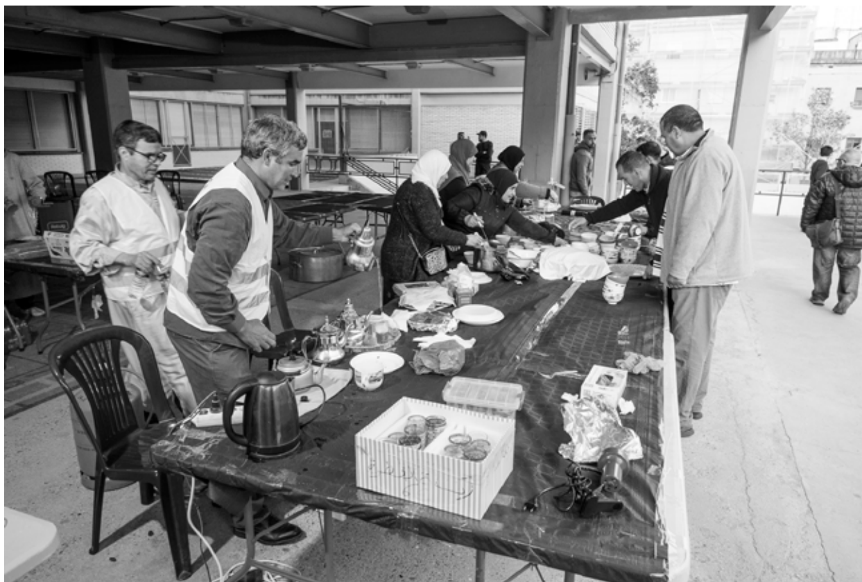
La comunitat islàmica de Nou Barris va celebrar l'Iftar amb tot el veïnat el passat 15 d'abril de 2023 a l'Institut-escola Molí. Joan Linux-9 Barris imatge

També cal fomentar una cultura del respecte i la tolerància envers la diversitat, així com promoure el diàleg i la resolució pacífica dels conflictes. Així és possible treballar per una comunitat més unida i equitativa on tothom pugui gaudir d'una vida digna i en harmonia amb la resta.