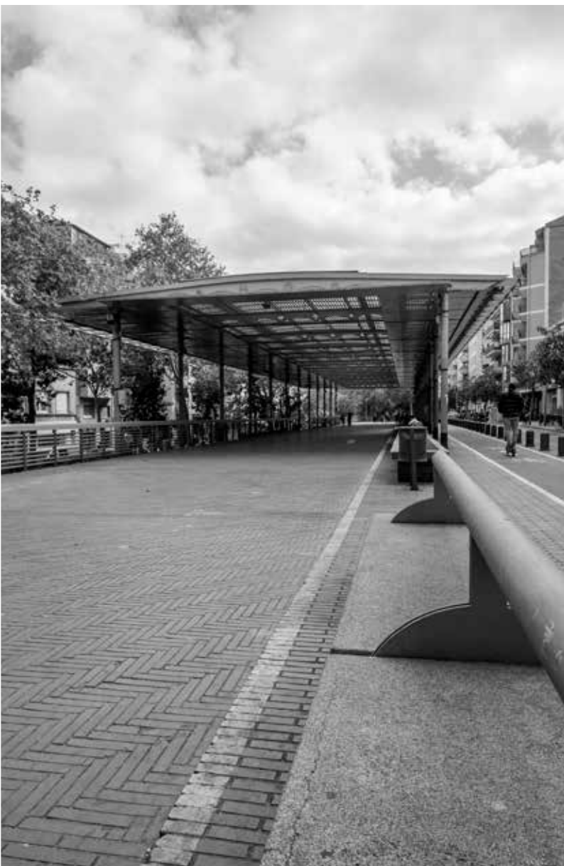
Una de les reivindicacions del barri de Verdum és la remodelació de la Via Júlia i la instal·lació d'enllumenat extraordinari i a la Marquesina per a actes culturals i festius. Joan Linux-9 Barris imatge